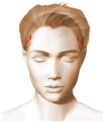
incisions = cicatrices

Chaque chirurgien adopte une technique qui lui est propre et qu'il adapte à chaque cas pour obtenir les meilleurs résultats. Toutefois, on peut retenir des principes de base communs :